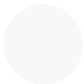
BLANC RAL 9016

*D'AUTRES COULEURS RAL DISPONIBLES SUR DEMANDE À UNE CHARGE ADDITIONNEL