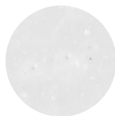
NUAGE DE PLUIE